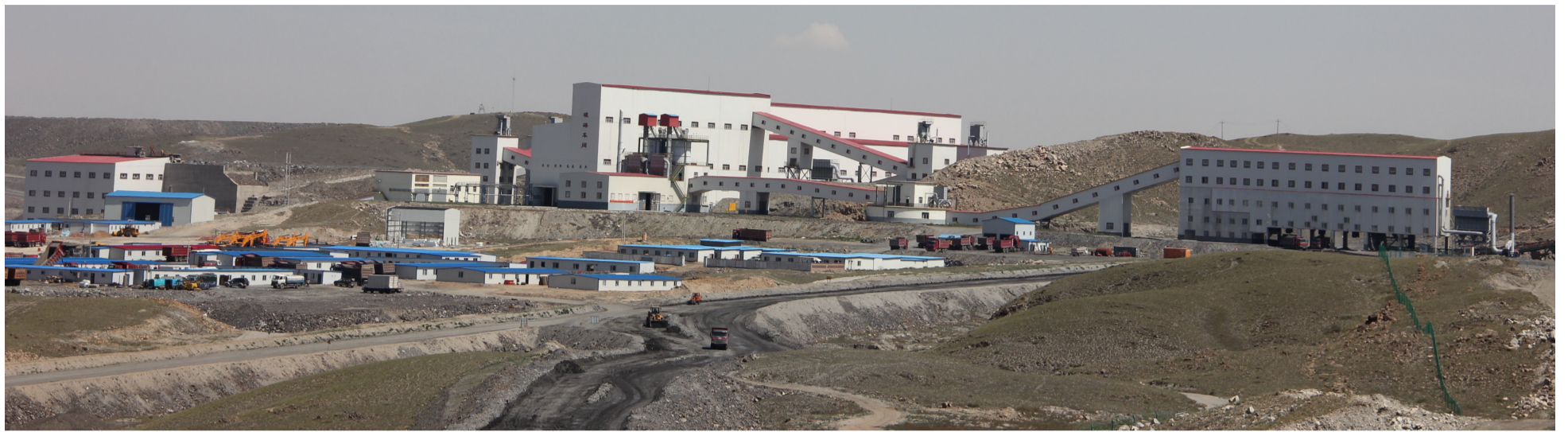
内蒙古太平矿业破碎站全貌

在长山壕矿区资源储量大幅增加的基础上，2012年9月，公司计划投资约10亿元实施二期扩建工程。二期工程计划于2013年下半年试车、投产。届时，公司产能、产量、利润、税费等重要指标将在“十二五”期间实现“翻番”目标，可以说是“再建一个太平”。